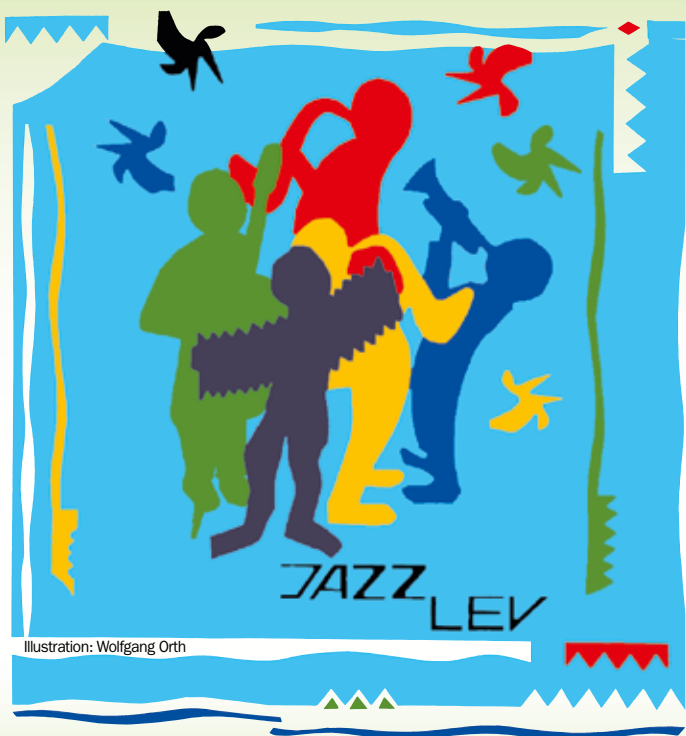
Illustration: Wolfgang Orth