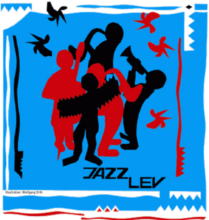
Illustration: Wolfgang Orth