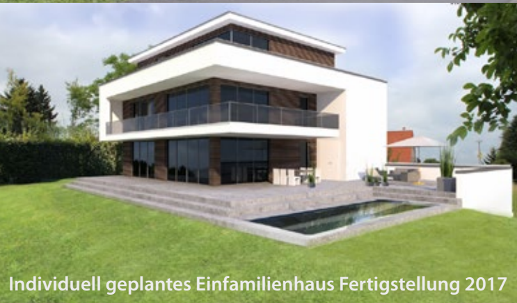
Individuell geplantes Einfamilienhaus Fertigstellung 2017